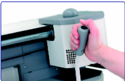
Facilidad de uso

El sistema se ajusta automáticamente a espesores y formatos de página diferentes, posibilitando la producción continua entre diferen-tes trabajos de encuadernación. Olvídense de los ajustes de tiempo o de formato de libro. Cualquiera puede realizar libros e informes de gran calidad en pocos minutos.