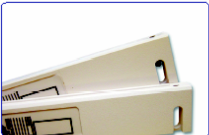
Barras de sujeción para tapas duras y blandas