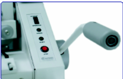
Panel de control de uso sencillo