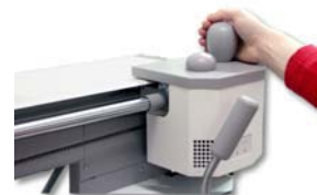
Silencioso y libre de olor

Fastbind Solución para hacer libros por demandas es orgullosamente distribuida en Latino América por ONDESYS Dealer/Support Network.