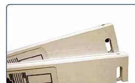
Barras para cubiertas Suaves y dura