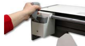
PGO Rallado del lomo sin sucio