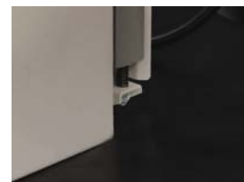
Rápido ajuste para distintos Grosos de lomo añadiendo Niveles

Contactar para demostración, muestras y futura información: