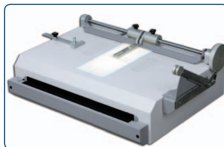
Unidad de sobre mesa compacta

El diseño y las especificaciones están sujetos a cambio sin previo aviso.