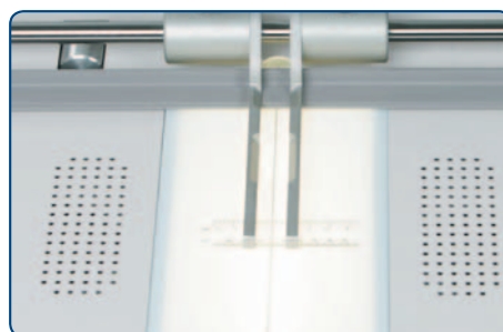
Línea de posicionamiento y asistente de succión