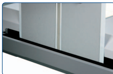
Plegadora de bordes