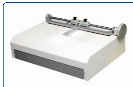
Unidad de mesa compacta

El diseño y las especificaciones están sujetos a cambio sin previo aviso