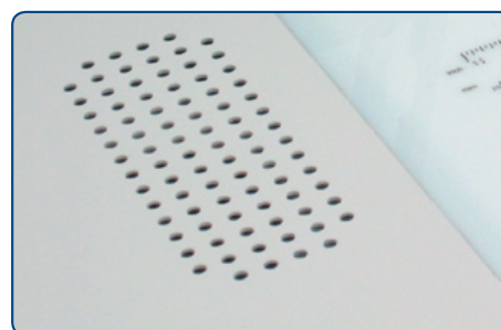
Asistente de succión