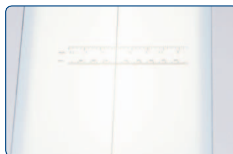
Mesa luminosa graduada