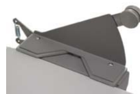
Cortador de esquinas opcional

Para demostracion, libros de muestras o futura informacion, contactar: