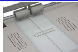
Linea de registracion con sistema de aspiracion

Fastbind solucion para hacer libros es orgullosamente distribuida en Latino America