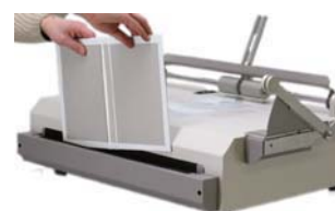
Casematic XT Doblador de Extremo Manual